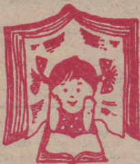
Рис. О. КОРНЕВА.